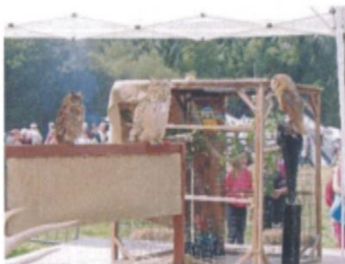
Le spectacle des rapaces